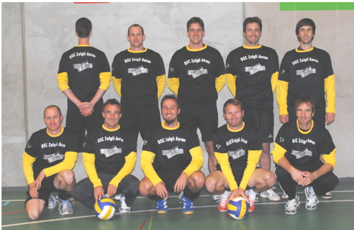
Das 3.Liga-Herren-Team mit dem neuen Eurobus-Pulli.